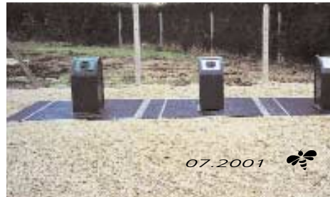
AVANT ET APRÈS ENFOUISSEMENT... SAINT-MARTIN-EN-BIÈRE