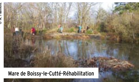
Mare de Boissy-le-Cutté-Réhabilitation