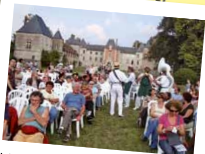
Intermède musical « Dixie » !