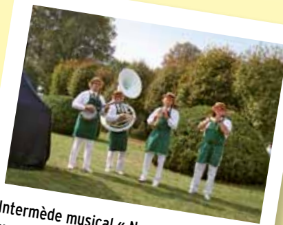
Intermède musical « New Orleans » avec les Jazzdiniers.