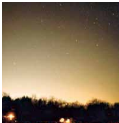
Ciel de 2002

Afin de réduire les halos, des aménagements techniques sont envisageables pour améliorer l'efficacité des lampadaires (flux vers le sol, LED, réducteurs d'intensité...) et, pour diminuer les plages d'éclairage, les programmeurs et les cellules détectrices de présence. ●