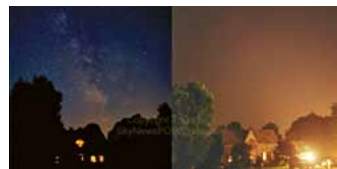
Blackout du 14 août 2003 au Canada

La preuve qu'il est possible de changer d'avis !