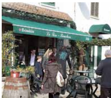
Des haltes pour les randonneurs

Par ailleurs, dans le cadre de sa démarche de gestion de la circulation des véhicules à moteur, le Parc propose aux communes des systèmes de fermeture de certaines voies publiques, afin de préserver les secteurs sensibles. Ces dispositifs pourront donc intervenir sur des chemins dédiés aux randonneurs. Résultat de ces deux actions conjuguées : les promeneurs pourront découvrir le territoire sur des chemins préservés, en toute sécurité.