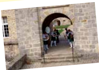
Accueil musical par les Jazzdiniers de Milly-la-Forêt.