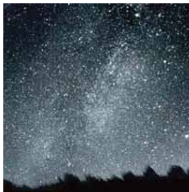
Ciel de 1950

versité, rappelons-le, sont loin d'être négligeables : disparition des insectes nocturnes, comme certains papillons de nuit qui s'épuisent à voler autour des sources lumineuses, puis faute d'insectes, des chauves-souris, désorientation des oiseaux migrateurs... Par ailleurs, les études réalisées sur des personnes exposées de nuit à la lumière artificielle ont révélé des troubles des biorythmes, du sommeil... Les effets sont également économiques et environnementaux puisque la fée électricité est devenue