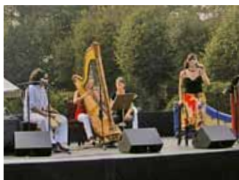
Les sons de l'Amérique latine avec un trio inattendu de harpe, percus et voix : l'Ensemble Alborada.