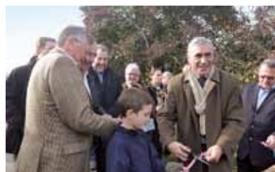
Inauguration à Boigneville

Alors que ceux qui aiment randonner en vélo quelques heures ou une journée se rassurent : ces circuits seront faits pour eux, pour cheminer entre les vallées de l'Essonne et de l'École, pour apprécier les petits trésors champêtres et architecturaux du Parc. ●