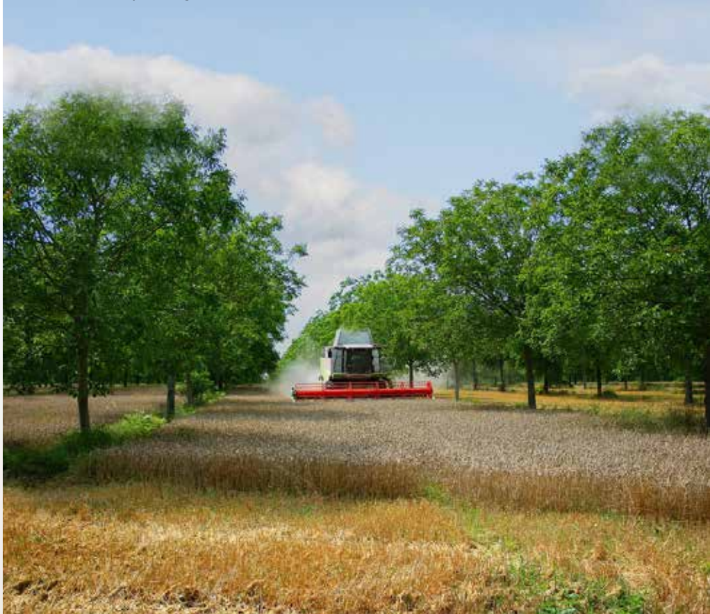
Illustration de la pratique de l'agroforesterie dans une plaine agricole

Par ailleurs, ils stockent du carbone pendant toute la durée de vie du matériau.