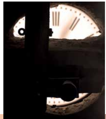
Horloge de Tousson