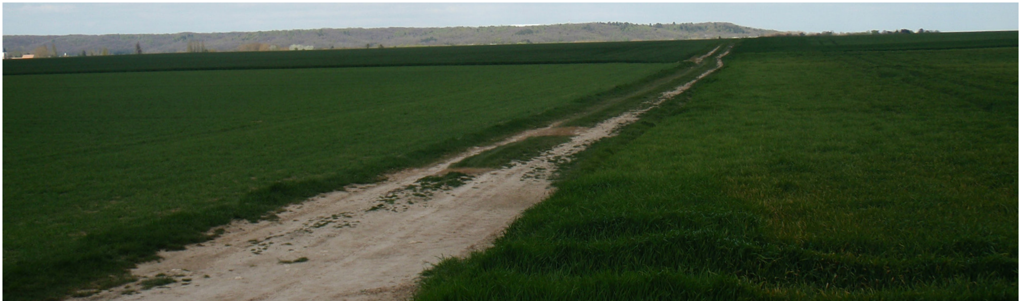
Avril 2012 (vue ouest, nord-ouest)

Veiller sur l'intégrité de cet espace ouvert agricole remarquable et rare dans l'entité.