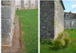
Arrêt du déshérage. Église d'Amorville

Les méthodes mécaniques, l'enherbement, les plantations, la réflexion des matériaux remplacent progressivement les désherbants chimiques.