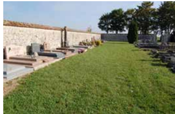
Le cimetière enherbé de Rumont.