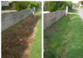
Arrêt du déshérage dans les caniveaux. La Chapelle-la-Reine (avant/après)