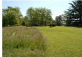
Tontes tardives. Base de Loisirs Seine-École. Saint-Fargeau-Ponthierry

La mise en place d'une gestion différenciée implique la rédaction d'un diagnostic et d'un planning de gestion.