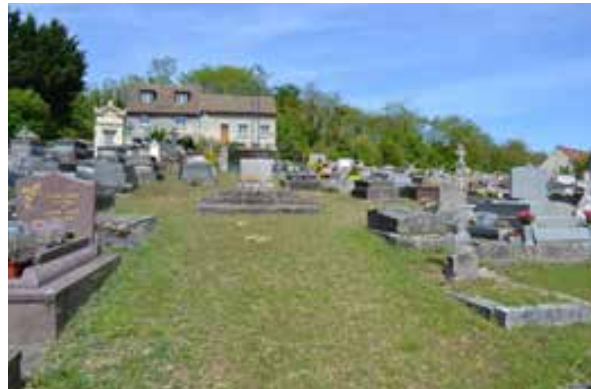
Le cimetière enherbé de Chamarande.