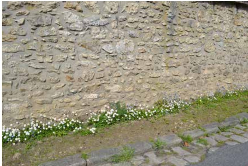
Les pâquerettes en mélange avec du myosotis habillent les pieds de murs sur la commune de Cerny.