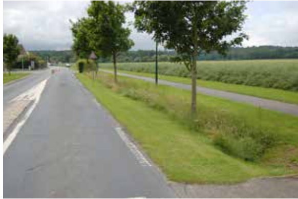
Sur la commune de Champcueil les fossés sont fauchés qu'une fois par an.

La gestion différenciée implique de redéfinir les objectifs d'entretien de chaque lieu suivant ses caractéristiques, sa fonction et sa fréquentation. Cela permet de ne pas appliquer à tous les espaces la même intensité de soins.