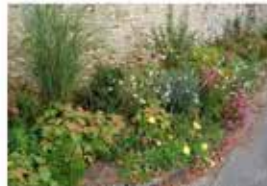
Fleurissement de vivaces. Donnemoutiers