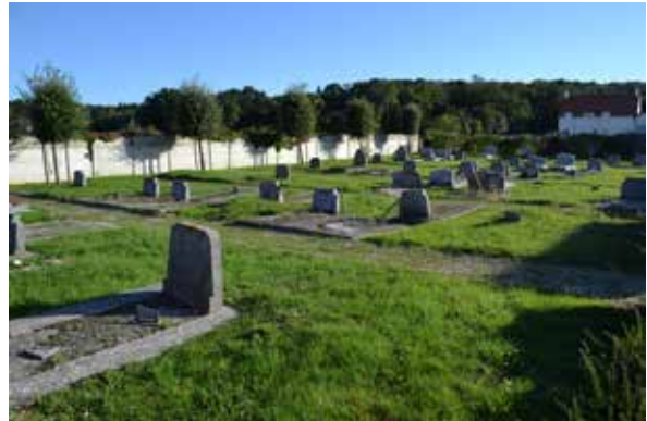
Le cimetière enherbé de Champcueil.