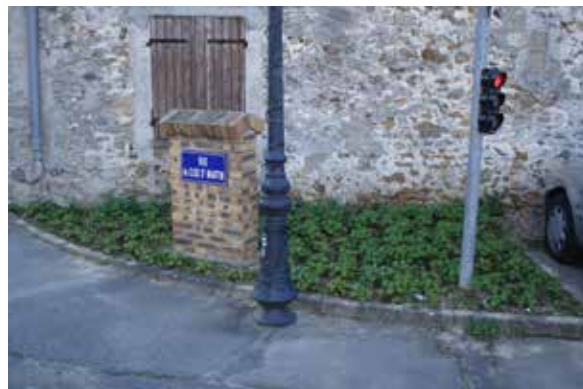
Plantation d'une couvre-sol sous un feu tricolore facile et efficace pour ne plus désherber sur la commune de Chevannes.