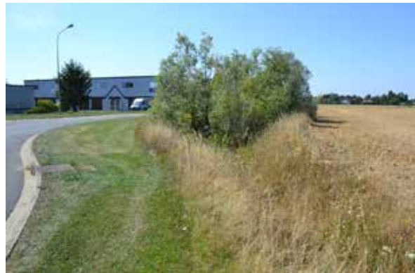
Les Communes participent elles aussi à la gestion différenciée des bords de route comme à Chevannes. Ce sont aussi tous les bords de routes départementales qui sont gérés en fauche tardive.