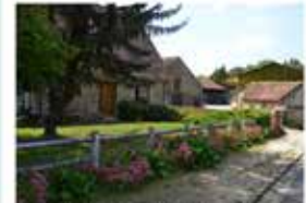
Perthes-en-Gâtinais (La Ranchie)