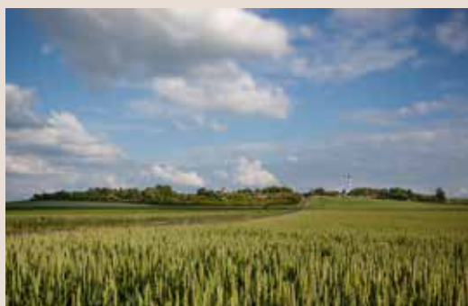
Photo prise à Rumont (vue sur Fromont)