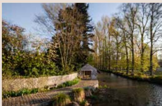
Photo prise à Gironville-sur-Essonne