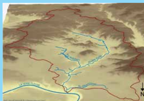
Vue en 3D du bassin versant de la rivière École

Un bassin versant est une cuvette naturelle, délimitée par une ligne de crêtes, à l'intérieur de laquelle les eaux s'écoulent et alimentent un réseau de cours d'eau qui se jette dans une rivière, un fleuve ou l'océan. Dans un bassin versant l'eau circule en : - ruisselant sur le sol, - s'infiltrant dans le sol, - s'écoulant dans les cours d'eau, - s'évaporant.