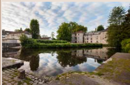
Photo prise à Milly-la-Forêt