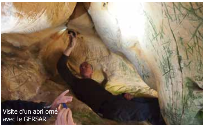
Visite d'un abri orné avec le GERSAR

Ces abris leur offraient des parois de grès propices à la gravure et, étant donnée leur taille, probablement une tranquille solitude. Une immortalité gravée dans la pierre.