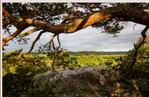
Photo prise au Vaudoué