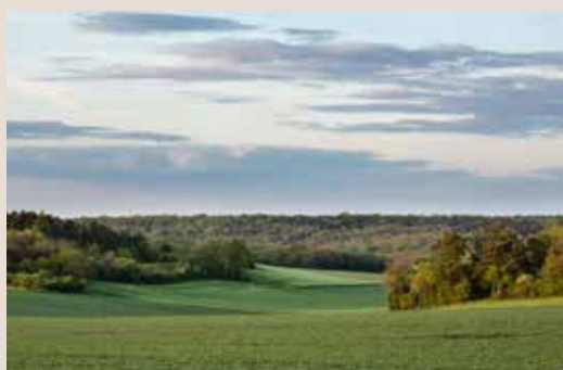
Photo prise à Courdimanche-sur-Essonne