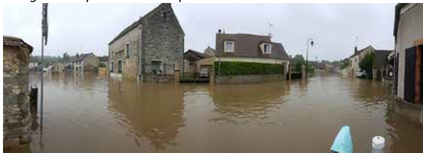
Cély-en-Bière victime des inondations en juin 2016.

Un bassin versant est une cuvette naturelle, délimitée par une ligne de crêtes, à l'intérieur de laquelle les eaux s'écoulent et alimentent un réseau de cours d'eau qui se jette dans une rivière, un fleuve ou l'océan. Dans un bassin versant l'eau circule en : - ruisselant sur le sol, - s'infiltrant dans le sol, - s'écoulant dans les cours d'eau, - s'évaporant.