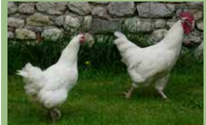
*Audureau Michel, Petite encyclopédie de la poule et du poulailler , Terre Vivante, 2015, p. 133-138

La Gâtinaise est une belle poule blanche appréciée pour sa prestation de pondeuse et sa qualité gustative. Elle se trouve d'ailleurs dans le top 4 du palmarès réalisé par trois fervents défenseurs des races locales et publié dans la Petite encyclopédie de la poule et du poulailler* , sur près de 40 races de poules.