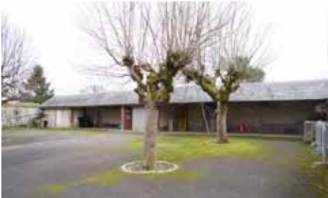
Le préau avant travaux