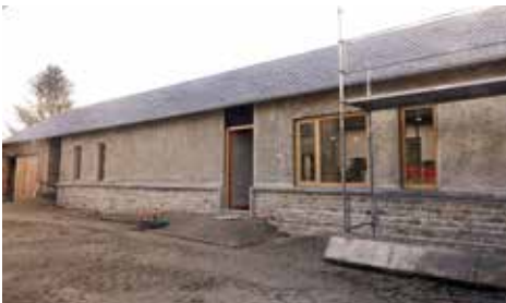
Le préau pendant les travaux, avec le chanvre projeté sur les murs extérieurs