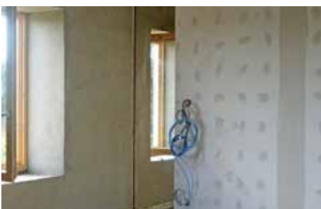
L'intérieur avec les murs enduits en chanvre