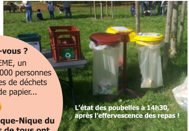
L'état des poubelles à 14h30, après l'effervescence des repas !

Vous pouvez aussi tenter le zéro déchet chez vous !