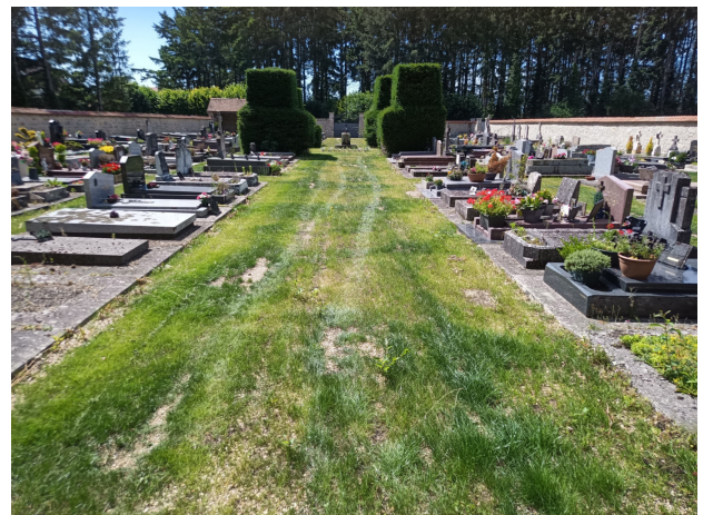
Enherbement du cimetière d'Arbonne-la-Forêt en 2021