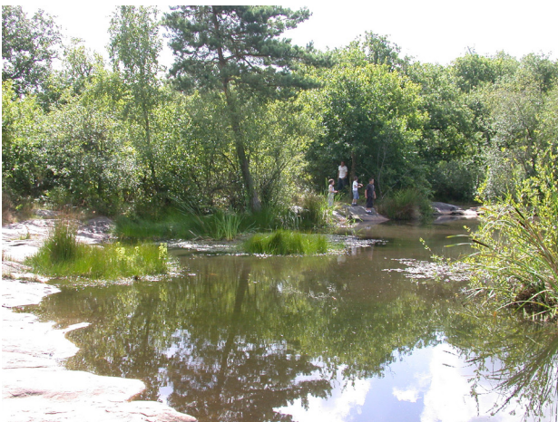
Restauration de la mare de Boissy-le-Cutté