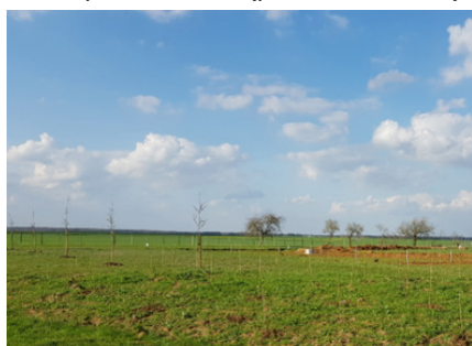
Milly-la-Forêt (parcours pour volailles)