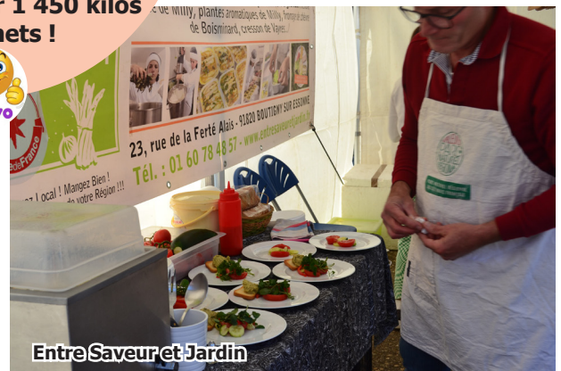
Entre Saveur et Jardin