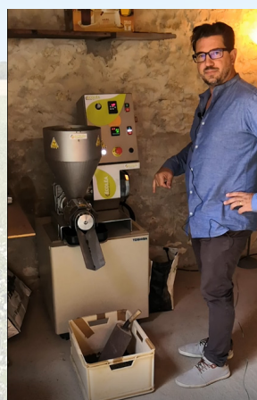
La presse à huile

Investissements financés dans le cadre du programme LEADER : moulin et presse à huile Financement européen FEADER : 5 730 € Financement Parc : 3 820 €