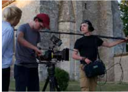
Tournage à Guercheville