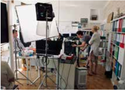
Tournage à Ormesson

Rdv samedi 17 juin 2023 à 15h à la Maison du Parc (20 bd du Maréchal Lyautey 91490 Milly-la-Forêt) pour la projection des trois courts-métrages en présence des équipes de tournage.