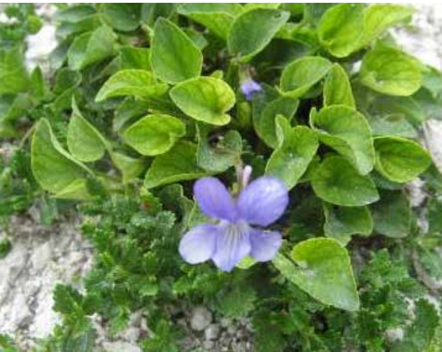
Violette des rocailles (Biotope)