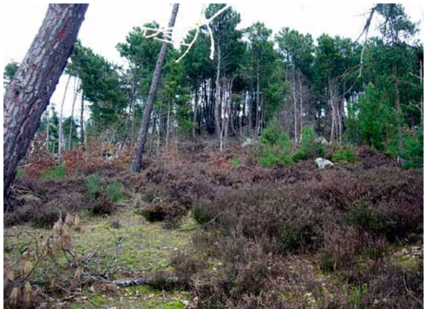
Lande sèche