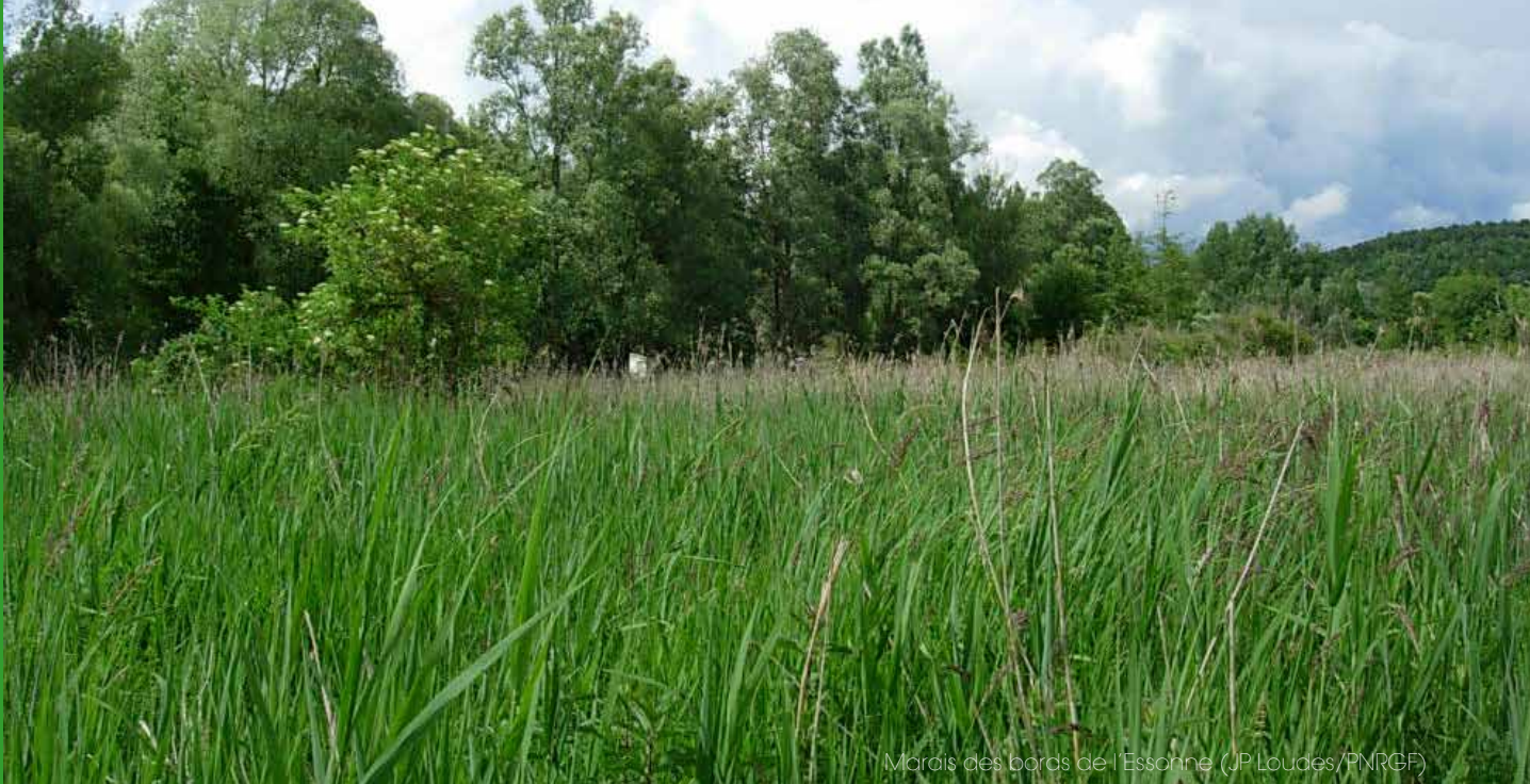
Marais des bords de l'Essonne