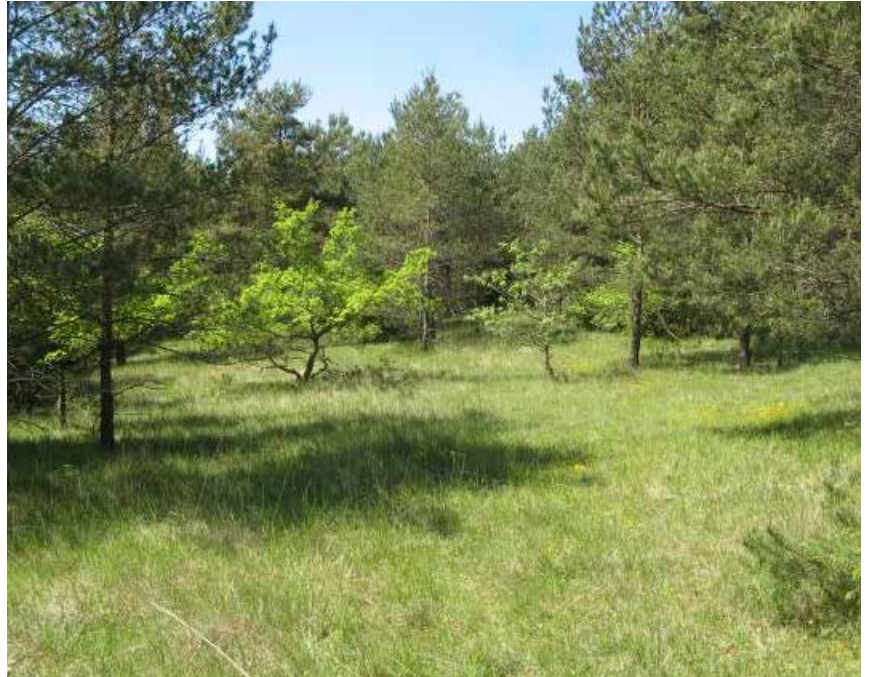
Pelouse semi-naturelle (Biotope)