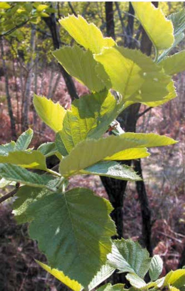
Alisier de Fontainebleau (N. Flament/PNRGF)

D'autres espèces végétales d'intérêt patrimonial sont présentes sur le site, comme par exemple l'Alisier de Fontainebleau qui est protégé au niveau national.