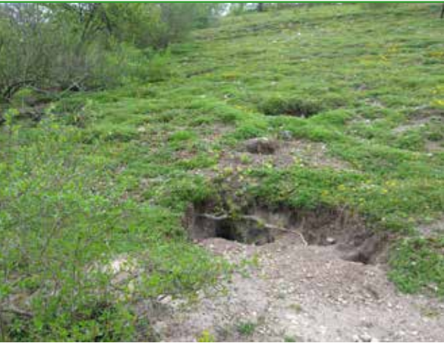
Pelouse calcaire sur sable

Ces milieux abritent une flore remarquable, comme par exemple un cortège d'orchidées dont certaines sont protégées, ou encore la Violette des rocailles (protégée au niveau régional).